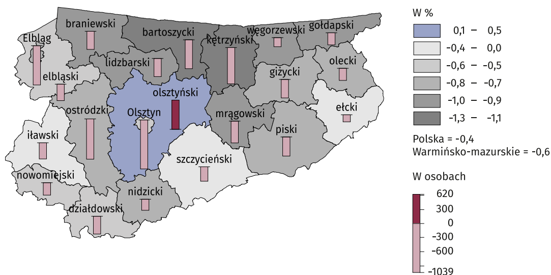
Mapa 1. Zmiana liczby ludności w 2022 r. 2021=100

Warmińsko-mazurskie należało do najmniej zaludnionych regionów kraju. W 2022 r. gęstość zaludnienia wynosiła 57 osób na 1 km 2 i była ponad dwukrotnie niższa od gęstości zaludnienia w Polsce (121 osób na 1 km 2 ). W miastach mieszkało przeciętnie 1 308 osób na 1 km 2 (w Polsce 1 000 osób), a na wsi 24 osoby na 1 km 2 (w Polsce 53 osoby).