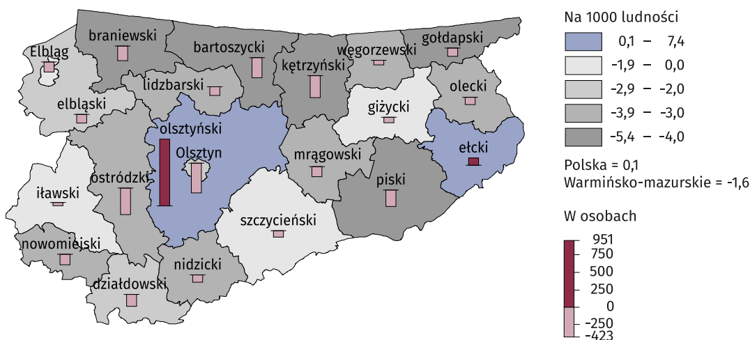
Mapa 2. Saldo migracji stałej w 2022 r.

W przypadku cytowania danych Głównego Urzędu Statystycznego prosimy o zamieszczenie informacji: „Źródło danych GUS”, a w przypadku publikowania obliczeń dokonanych na danych opublikowanych przez GUS prosimy o zamieszczenie informacji: „Opracowanie własne na podstawie danych GUS”.